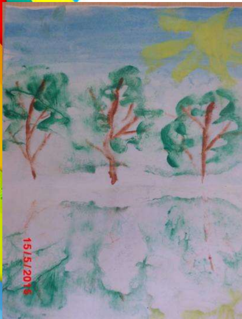
рисунок отпечатывается на другую поверхность.