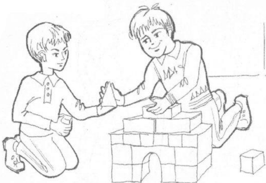
Рисунок Б.2- «Сюжетные картинка» Р.Р. Калининой