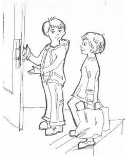
Рисунок А.1- «Сюжетные картинка» Р.Р. Калининой