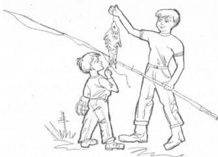
Рисунок Г.4- «Сюжетные картинка» Р.Р. Калининой