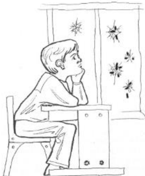
Рисунок Д.5- «Сюжетные картинка» Р.Р. Калининой