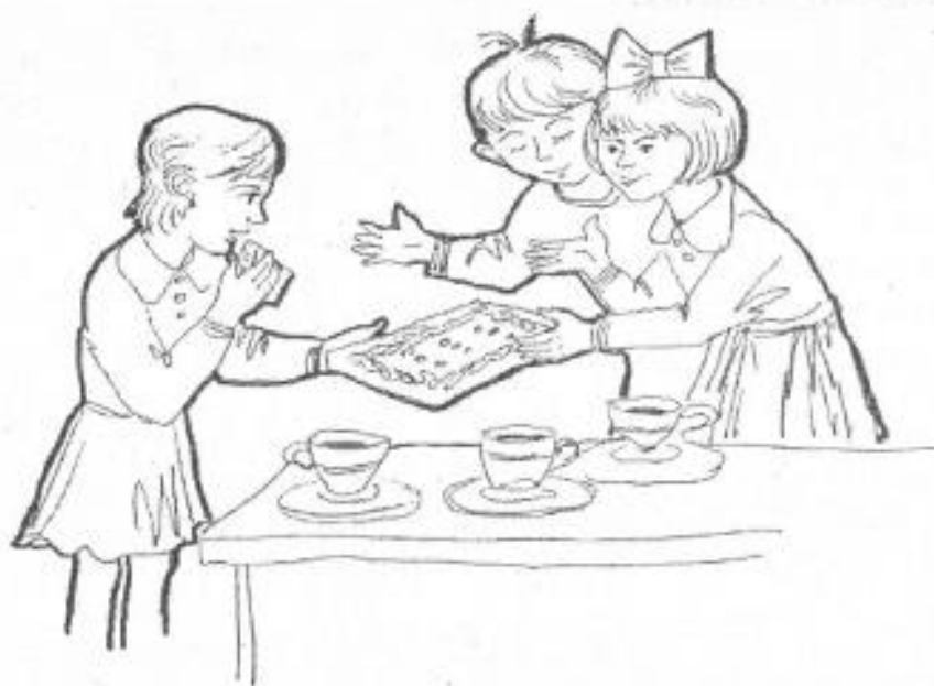
Рисунок В.3- «Сюжетные картинка» Р.Р. Калининой